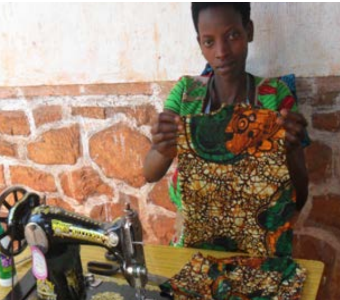
Hemd voor een 5-jarig kind