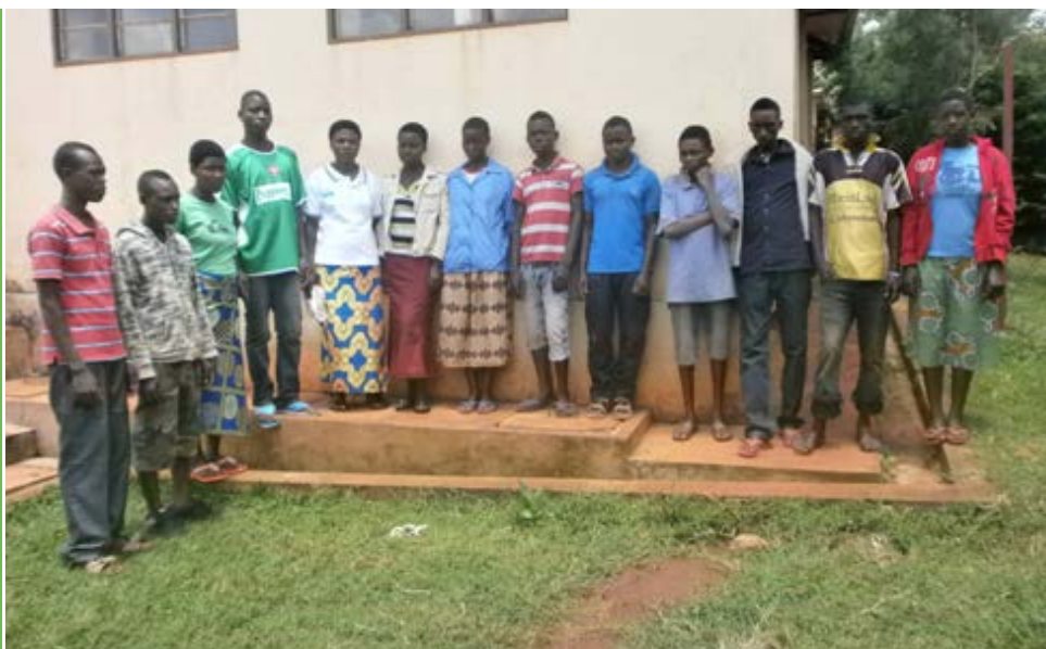
De geselecteerde kandidaten voor de opleidingen