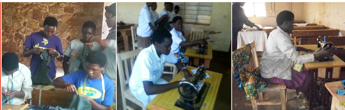
De kandidaten tijdens de opleiding naaien