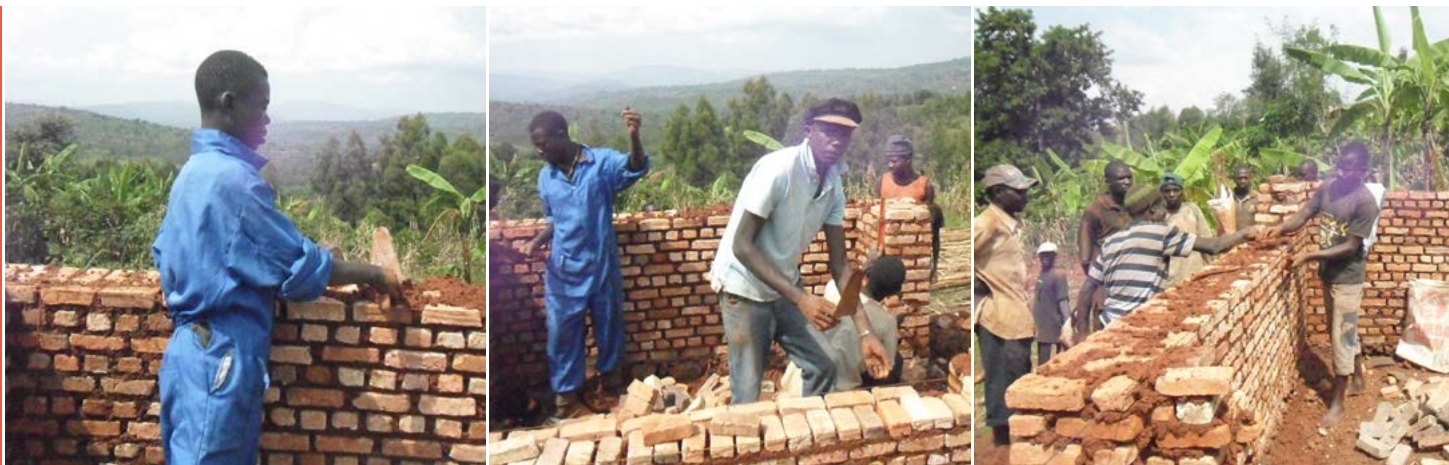
De kandidaten tijdens de opleiding metselen