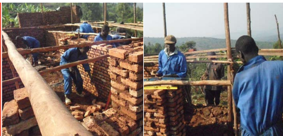
De kandidaten aan het werk op een bouwplaats

De naaisters hebben gescheurde kleding van burenen hersteld: zo beseften die dat de leerlingen hun opleidingsperiode goed gebruikt hebben – anders dan sommige dorpsgenoten dachten op het moment van de selectie....zeker nu blijkt dat ze echt iets geleerd hebben en kunnen toepassen voor anderen!