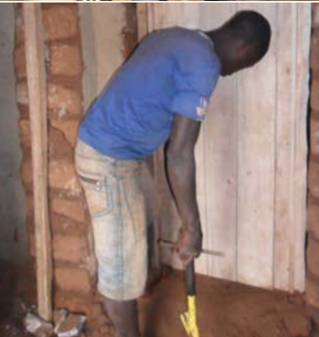
Plaatsen van zelfgemaakte deur

“Ik heb 2 tafels, 4 banken, en 2 deuren gemaakt. Al dit gemaakte materieel is verkocht. De productie is beperkt want ik heb nog niet mijn eigen materiaal en mijn atelier. Beperkingen genoeg want ik mis voldoende gereedschap, hoewel ik de opleiding goed heb doorstaan. Hoewel ik mezelf red in de ateliers van anderen, doe ik dat liever in mijn eigen atelier, terwijl ik wel geassocieerd blijf met de andere timmerlieden, om zo nog niet besproken fabricaten te leren, zoals bijvoorbeeld kasten. Dan kan ik meer volume maken met een complete set gereedschappen. Ondanks deze uitdagingen kan ik in mijn levensbehoeften voorzien. Nu kan ik kleren kopen, terwijl voorheen mijn ouders dat moesten betalen. Ik kan in de toekomst zelf mijn huis gaan bouwen.”