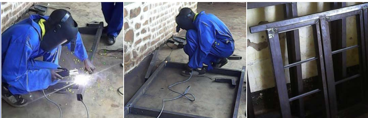
De kandidaten tijdens de opleiding lassen