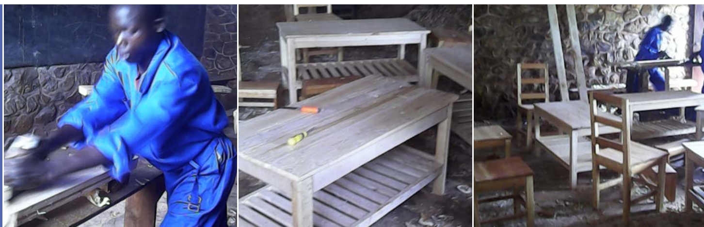
De kandidaten tijdens de opleiding timmeren en hun eerste start met inkomsten genereren