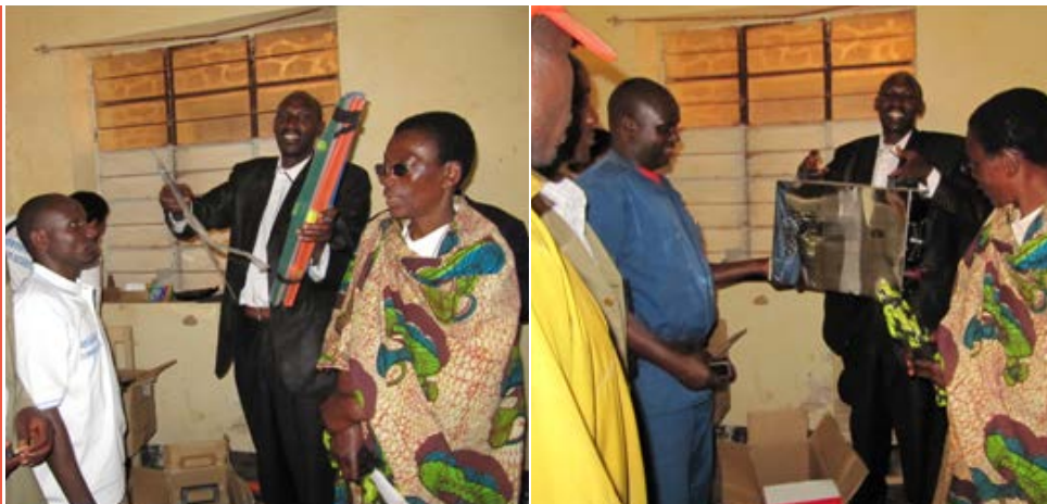
Presentatie door de projectcoördinator van de materialen voor de training

Het theoretische gedeelte was begonnen op 12 augustus 2014, waarna op 23 augustus het praktisch gedeelte ook kon starten.