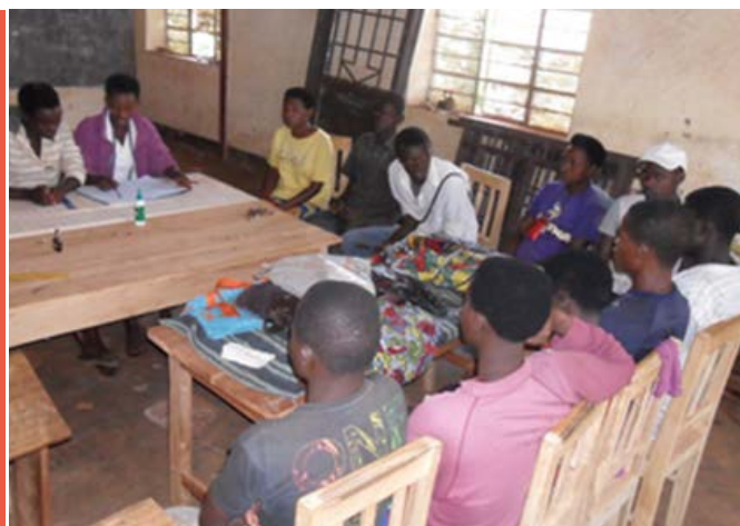
Foto van de deelnemers aan een SILC vergadering